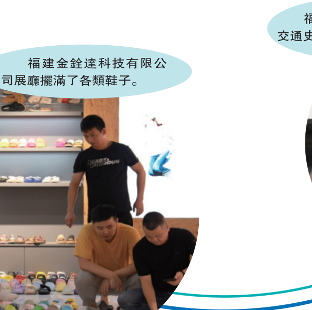
福建金銓達科技有限公司展廳擺滿了各類鞋子。