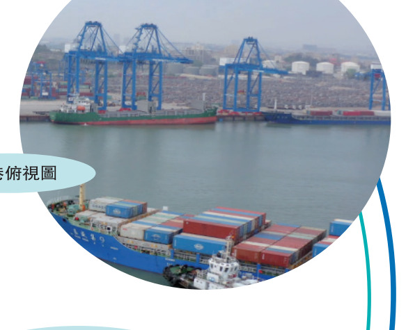
福船資料圖